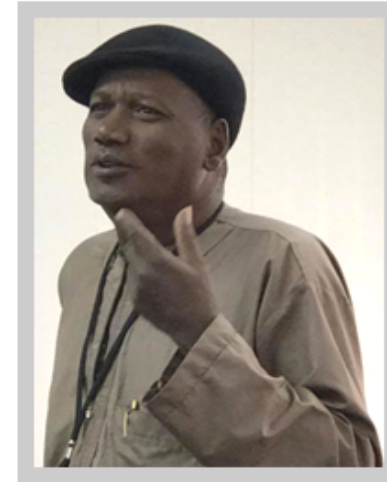
Au colloque MANSA, Grand Bassam, 2017.